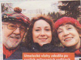
Umelecké vohy zdedila po svojich milovaných rodičoch.

– Som vďačná za pomoc. Aj keď si môže niekto myslieť, že sme hrdé na to, čo všetko zvládam bez mužov, strašne dobre nám pomoc padne. Ale požiadať o ňu sa niekedy hanbím. Raz som sa pokúšala naliať benzín z kanistry. Ťažké to bolo ako frás, trápila som sa s tým. Za mnou stál nejaký muž a pozoroval ma. Čakala som, že mi azda príde džentlmensky pomôcť. A on zase čakal, že ho o tú pomoc požiadam. Tak fakt neviem.