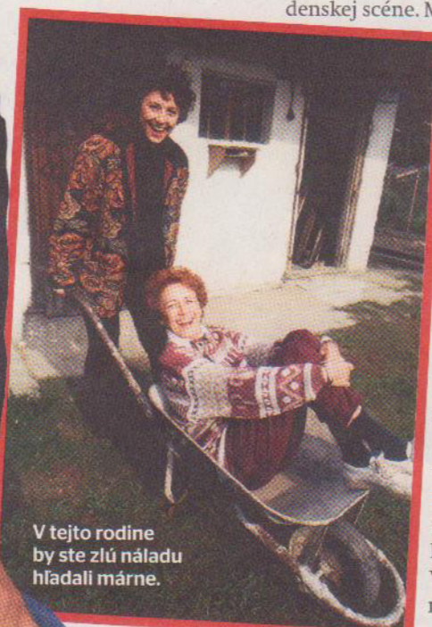
V tejto rodine by ste zlú náladu hľadali márne.