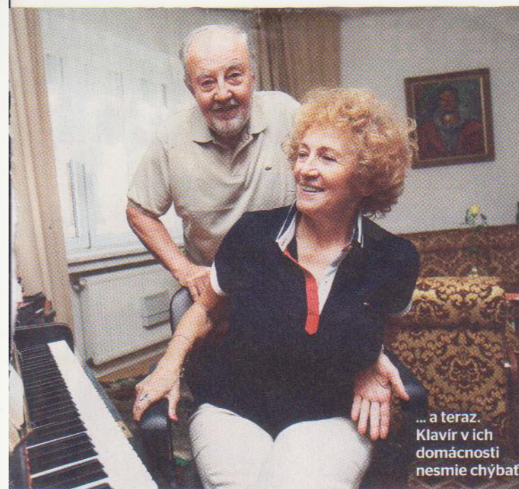
... a teraz. Klavír v ich domácnosti nesmie chýbať.