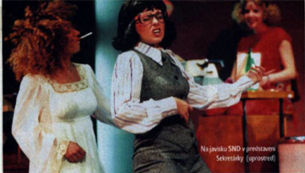
Na javisku SND v predstavení Sekretárky (uprostred)